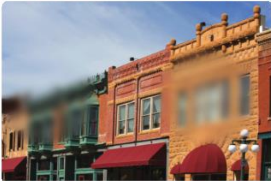
La imagen superior muestra un campo de visión normal. Un ejemplo de daño temprano a moderado en la visión es mostrado en la imagen inferior.